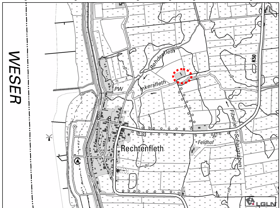
Abb. 1: Lage des Geltungsbereichs rot gestrichelt markiert

Der Änderungsbereich liegt nordwestlich der Gemeinde Hagen im Bremischen, nordöstlich der Ortschaft Rechtenfleth und nördlich sowie südlich an der Zufahrtsstraße „Zwischen-deichsweg“ am Inkersfleth. Das Plangebiet umfasst etwa 1,26 ha. Die räumliche Lage ist der nachfolgenden Abbildung zu entnehmen, die genaue Abgrenzung der Planzeichnung.