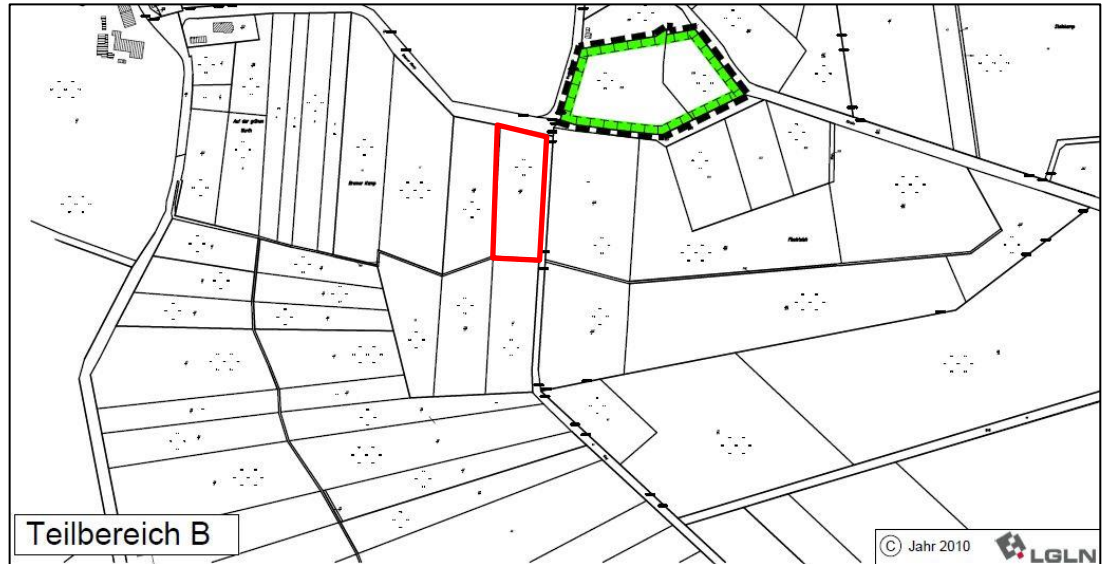
Abb. 3: Kompensationsfläche (Teilfläche B; schwarz gestrichelt umrandet) des Bebauungsplans Nr. 51 der Gemeinde Hagen im Bremischen und die Lage des Geltungsbereichs der 74. Änderung des Flächennutzungsplans (rot umrandet)

Der Änderungsbereich wurde bisher noch nicht mit einem Bebauungsplan überplant. Etwa 22 m nordöstlich des Änderungsbereichs befindet sich eine externe Kompensationsfläche (Teilbereich B) des Bebauungsplans Nr. 51 „Östlich der Wassergarde“ der Gemeinde Hagen im Bremischen aus dem Jahr 2017.