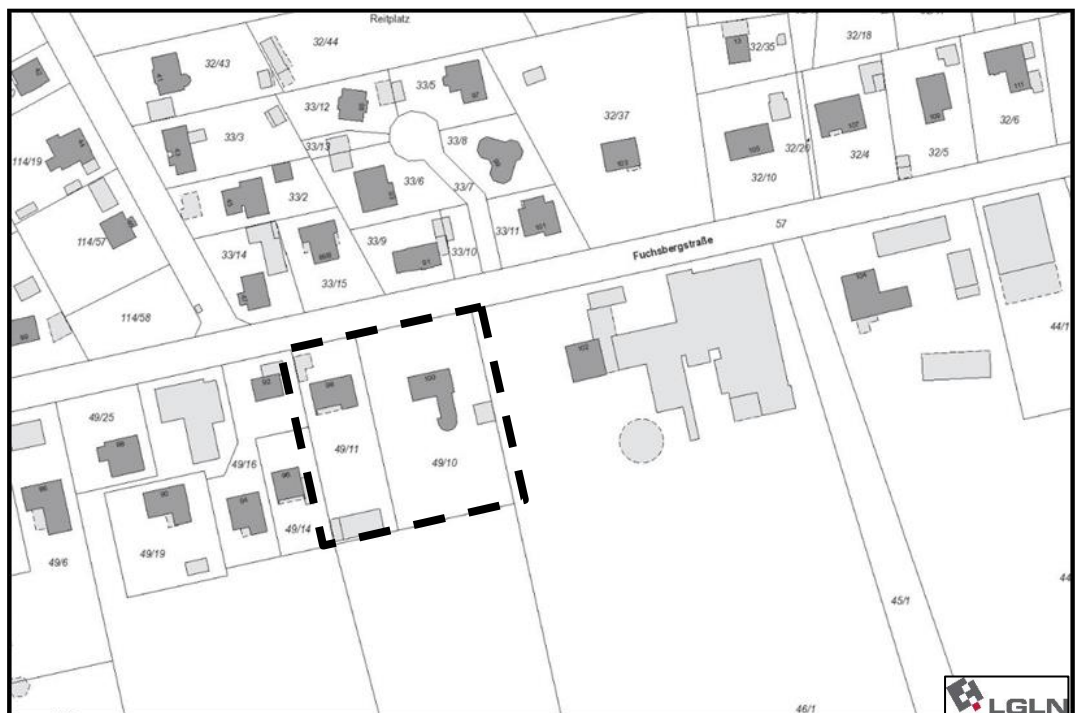
Abb. 1: Änderungsbereich schwarz gestrichelt markiert (nicht maßstäblich), Quelle: Amtliches Liegenschaftskataster; Quelle der Kartengrundlage: Landesamt für Geoinformation und Landesvermessung Niedersachsen)

Die räumliche Lage des Änderungsbereiches ist der nachfolgenden Abbildung zu entnehmen.